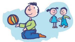
Ne joue pas avec les autres enfants