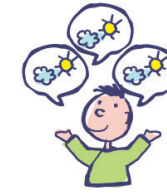
Parle de façon incessante sur un sujet particulier