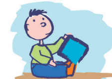
Manque de jeux imaginatifs