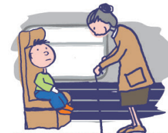
Comprend mal les conventions et les règles sociales