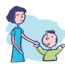
Rit de façon inappropriée