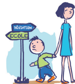
N'apprécie pas les changements