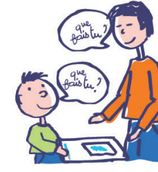
Utilise le langage de façon écholalique