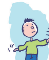
Présente des comportements bizarres