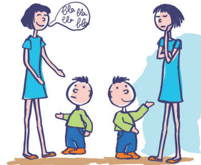
A du mal à comprendre et à se faire comprendre