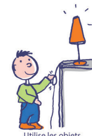
Utilise les objets de façon atypique