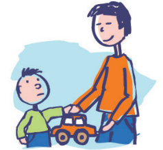
Indique ses besoins en utilisant la main de l'adulte