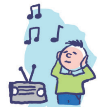
Peut être hypersensible aux sons, aux odeurs...