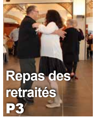
Repas des retraités P3