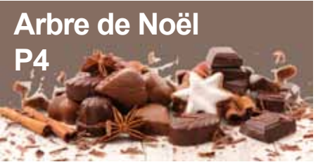
Arbre de Noël P4