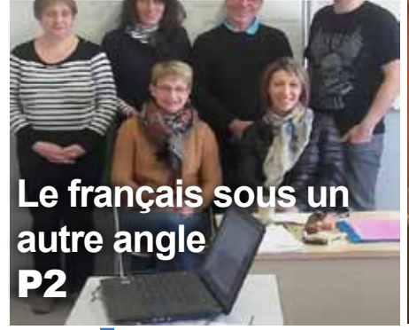
Le français sous un autre angle P2