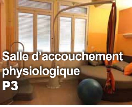
Salle d'accouchement physiologique P3